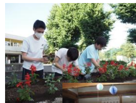
校内 花壇 植栽