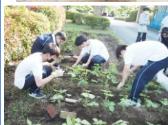
ドリーム の郷 ディサー ビス